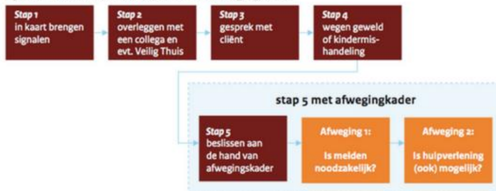
Figuur 2: Nieuwe situatie: Meldcode met afwegingskader

De Meldcode in relatie tot het beroepsgeheim en het meldrecht kindermishandeling en huiselijk geweld. Zie bijlage 2 voor de verantwoordelijkheden van Nutsschool M.M. Boldingh.